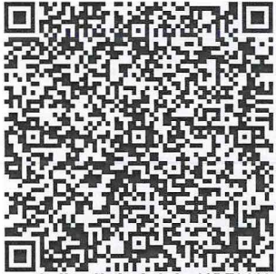
Sello digital del emisor

Subtotal 137.07 IVA 16% 21.93 TOTAL 159.00